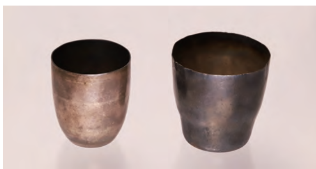
掲載写真 上段：理科大学 化学科教授研究室 / 大正 2 年 (1913) 頃 下段 (左から)：「ニッポニウム」の X 線スペクトルを撮影した写真乾板、功績を顕彰して造られた小川記念園 (片平地区)、小川使用と伝わるルツボ