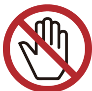
ケースなどにさわらない